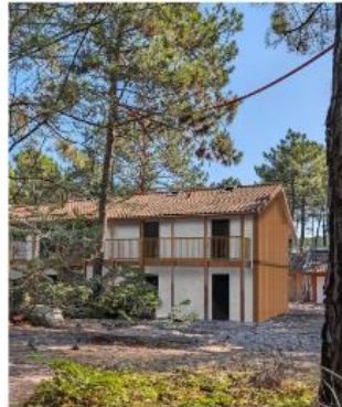
1. Point de vue projeté