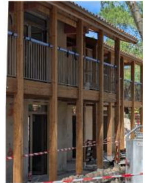
3. Photographie de la façade Ouest de Mautchic