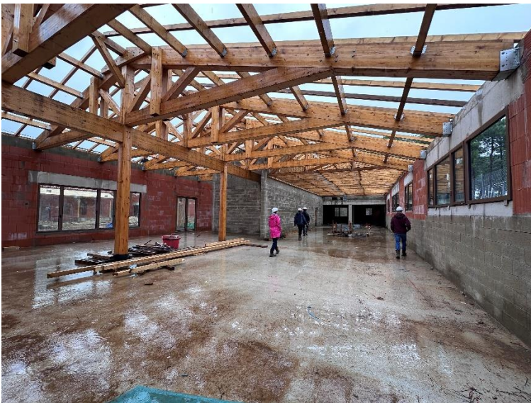
Die neue Rezeption